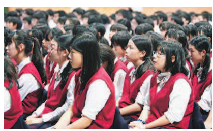
「いのちの授業」に聞き入る生徒たち。二いづれも駿中

駿台甲府中（河崎哲郎校長）のテーマは「自立への滑走路」未来の自分づくり。中高一貫教育のメリットを生かし、確かな学力の確保はもちろん、豊かな人間性や挑戦する心の育成にも力を注ぐ。広島への修学旅行を控えた2年生を対象に、力を注いでいるのが平和教育と命の大切さだ。